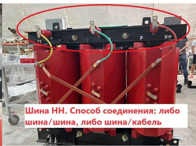
Шина НН. Способ соединения: либо шина/шина, либо шина/кабель