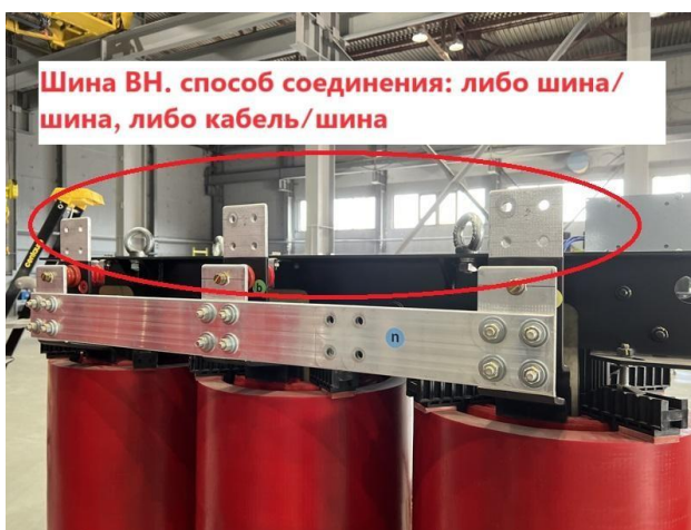
Шина ВН. способ соединения: либо шина/шина, либо кабель/шина