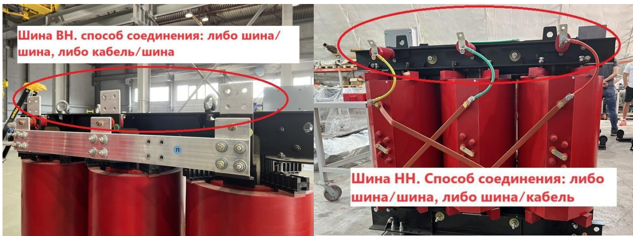
Шина ВН. способ соединения: либо шина/ шина, либо кабель/шина