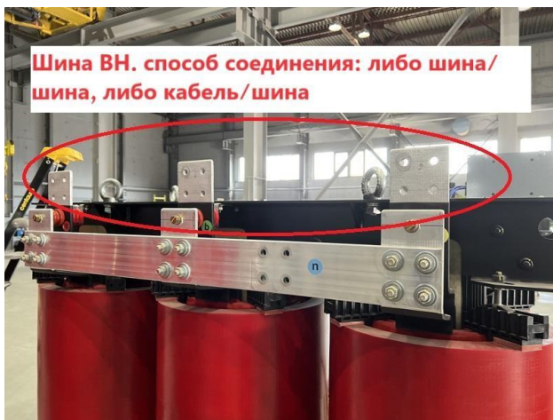
Шина ВН. способ соединения: либо шина/шина, либо кабель/шина