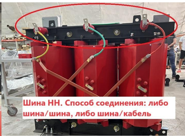
Шина НН. Способ соединения: либо шина/шина, либо шина/кабель